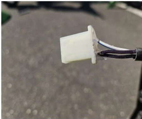
Blauwe draad klaar om door te knippen

Tip: Gebruik een krimp tang voor een professionele en veilige verbinding.