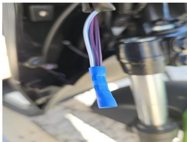
Draden verbonden met blauwe krimpstekker