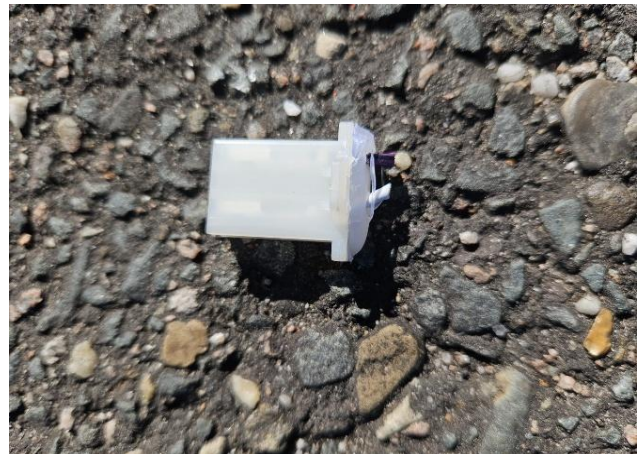
Stekker ná het afknippen