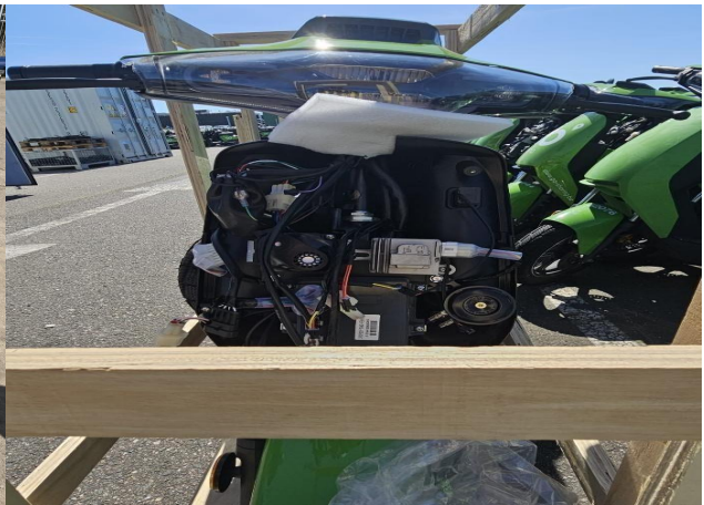
Bedrading rondom alarmmodule