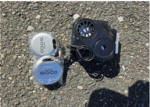
Nieuw alarm met 2 meegeleverde handzenders