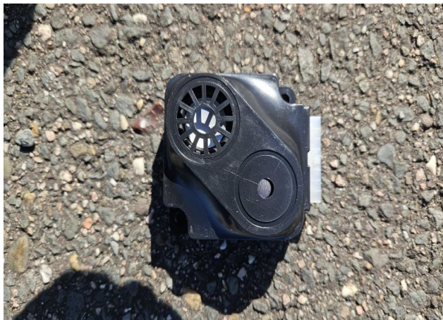
Oud alarm (verwijderd)